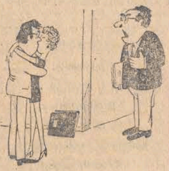
Hej, młody człowieku... to jest MOJA sekretarka!