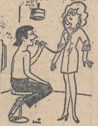
— Kocham panią doktór...