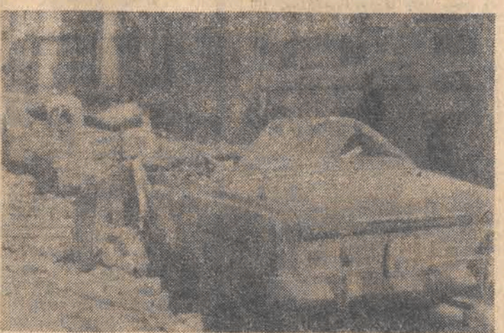
Nr: Rozbite zwalami gruzów samochodu.

H uk, chociaż wydobywał się spod ziemi, narastał jakby nad dachami miasta przeciągała eskadra ciężkich bombowców. Podłoga zaczęła się ugiąć pod nogami a dom zakłócił się wciągając w ten przerażający rytm wszystko i wszystkich. Ktoś, a może było to kilka głosów, krzyczał strasznie: cutremul, cutremul... trzęsienie ziemi!