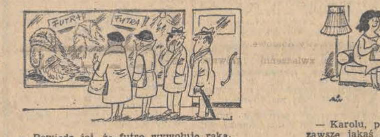
— Powiedz jej, że futro wywołuje raka... — Karolu, powiedz wreszcie coś... masz przecież zawsze jakąś głupią historijkę do opowiedzenia!