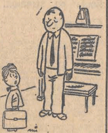
— To był zły dzień dla Chopina, prawda, panie profesorze?