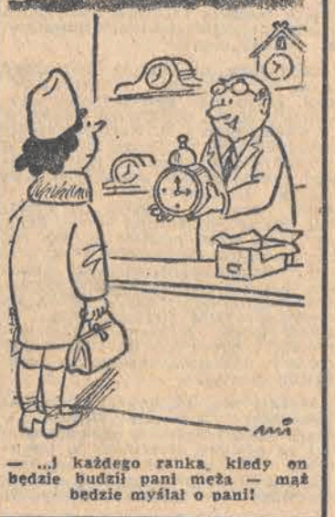
— „...każdego ranka kiedy en będzie budził pani meża — mał będzie myślał o pani!”