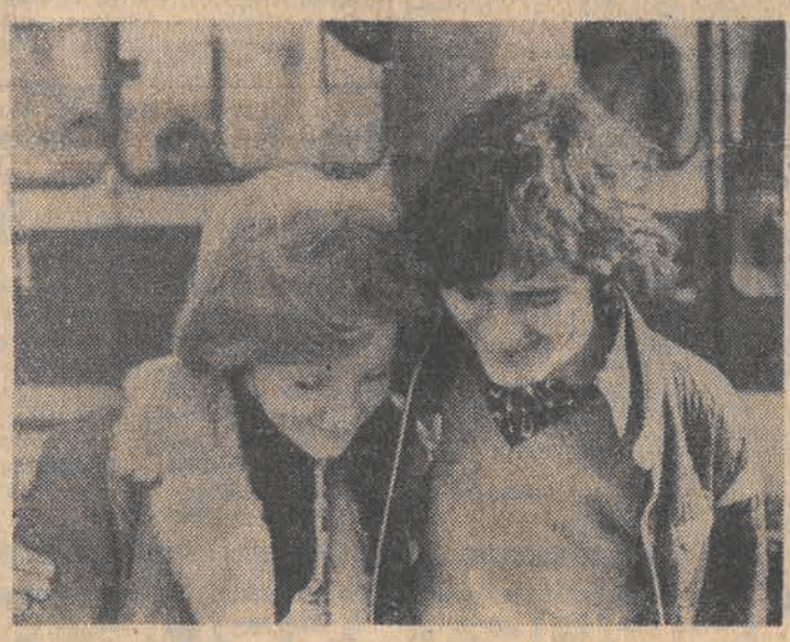
Nr: Wiosenny obrazek stołecznej ulicy.

14 marca br. Plenum KŁ PZPR W dniu 14 marca br. w lokalu Łódzkiego Ośrodka Szkalenia Ideologicznego KŁ PZPR odbędzie się plenarne posiedzenie Komitetu Łódzkiego PZPR nt. „Zadania w zakresie umacniania dyscypliny społecznej, bezpieczeństwa,ładu i porządku w województwie łódzkim miejskim.” Początek obrad o godz. 9.