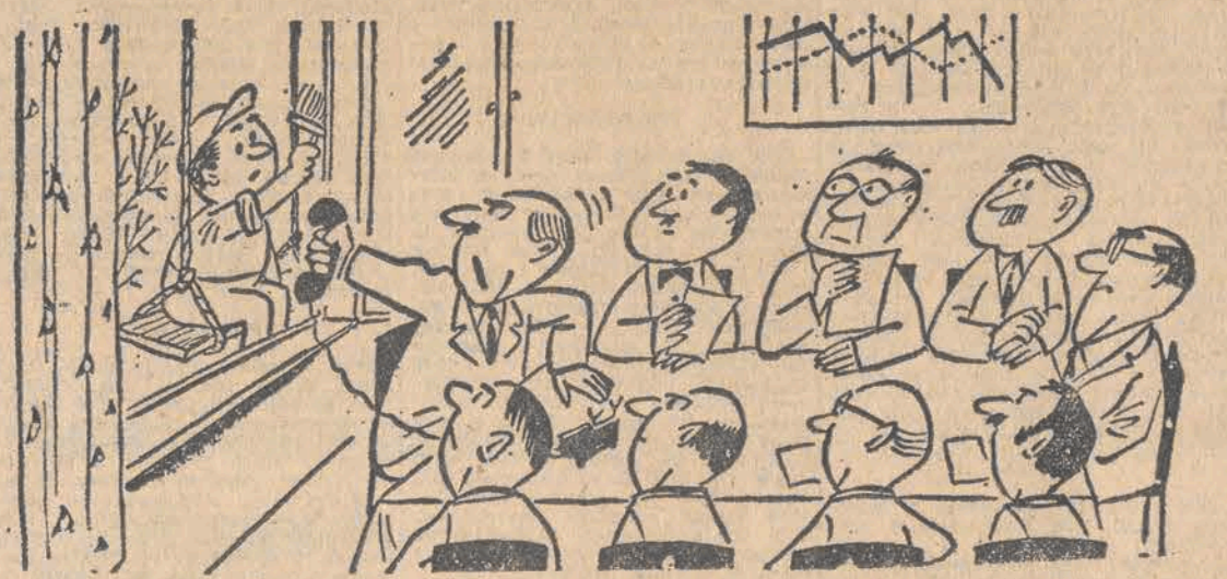
— Do Was telefon z Wrocławia...