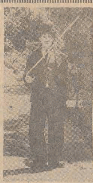
Gdy niedawno na jednej z ulic Hollywoodu kamerzyści telewizji rozpoczęli kręcenie ulicznej scenki...