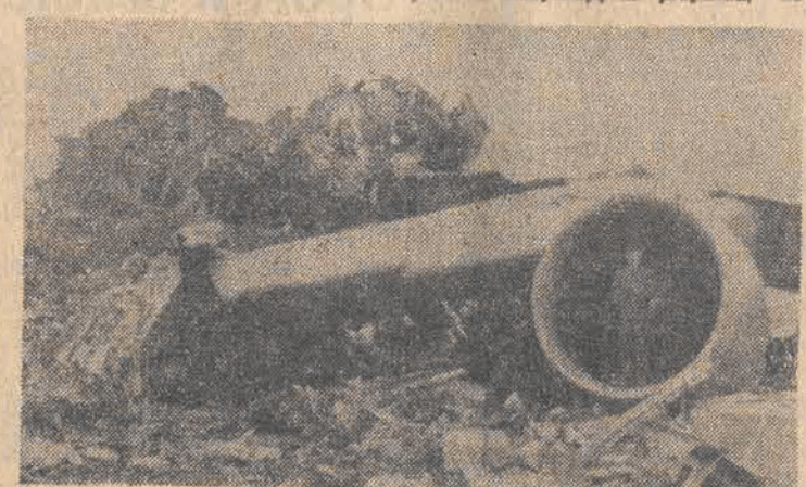
Na zdjęciu: wraki samolotów KLM i Panam

Administracja największej brytyjskiej firmy samochodowej „British Leyland” przyznała, że w roku ubiegłym jej zakłady wypuściły na rynek co najmniej 290 tys. samochodów z poważnymi defektami, mogącymi spowodować awarie i katastrofy. Ustalenie adresów właścicieli tych samochodów, przegląd i usunięcie defektów będzie kosztować firmę około 1,5 mln funtów szterlingów.