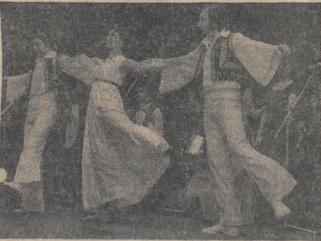
Konkurencjom finałowym towarzyszyły występy m. in. greckiego zespołu „Hellen”, który od razu podbił serca publiczności.