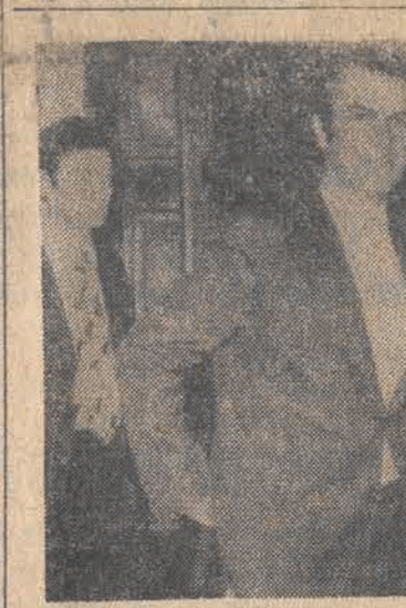
N/z: spotkanie D. Owena z przywódcą rodezyjskiego ruchu wyzwolenieckiego Robertem Mugabe w Dar es-Salaam.