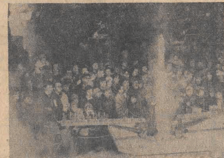
N/z: w pawilonie kosmicznym przy makiecie kosmodromu Bajkonur - podczas startu rakiety.

na warszawskiej wystawie osiągnięć radzieckiej nauki i techniki oraz "Dzień Budowy Maszyn" na wystawie w Katowicach.