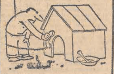
— Azor, do ciebie...