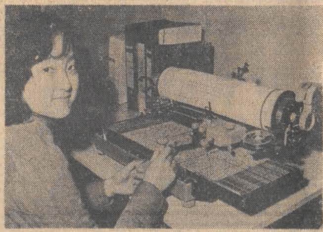
Nawet mistrzyni Polski w maszynopisanu miałyby ogromne kłopoty, by pisać choćby w nierekordowym tempie na tej maszynie do pisania. Podczas gdy normalna maszyna liczy sobie średnio 30 czołonek, chiński model ma aż 2313 znaków! Dlatego maszynistka w chińskim sklepie w Hamburgu musi być nie lada specjalistką, by napisać nawet najkrótszy tekst.

Na atlantyckim wybrzeżu Maroka niedaleko Rabatu natrafiono na ślady osadnictwa z końcowego eokenu starszej epoki kamiennej. Archeolodzy znaleźli w grotach wapiennych pozostałości obozowisk datowanych na 10 do 20 tys. lat temu. Były to siedziby myśliwych którzy polowali na zwierzęta ładowe — nie interesowali się natomiast żadnymi zasobami morza. Inne odkrycia potwierdzają istnienie w tej części Maroka osadnictwa już 30—35 tys. lat temu.