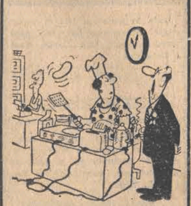
...Czy pani nie przesadza z tą przerwą śniadaniową?