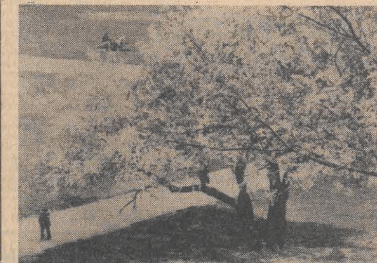
CAF — Uchymiak — teletext

Ostatni dzień kwietnia i pierwsze dni maja przyniosły niemal w całym kraju bardzo wysoką temperaturę, sięgającą 30 st. na południowo-wschodzie, 27-29 st. w centrum, a tylko na północnym zachodzie było np. 1 maja tylko 6 st. Warszawa była 30 kwietnia i 1 maja najcieplejszą stolicą Europy, cieplejszą o kilka stopni od Aten, Rzymu, Lizbony, czy Madrytu. W stolicy notowano bowiem aż 28,1 stopnia. (Dalszy ciąg na str. 2)