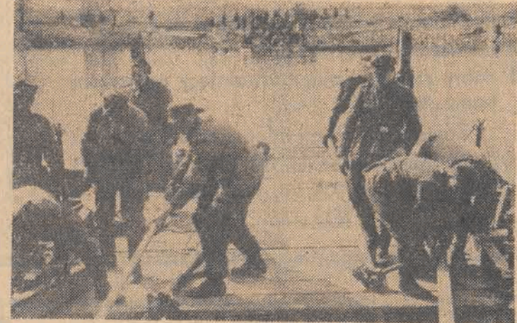
N/zi saperzy i Armi WP przygotowują na Odrze środki przeprawowe dla czołgów i artylerii.