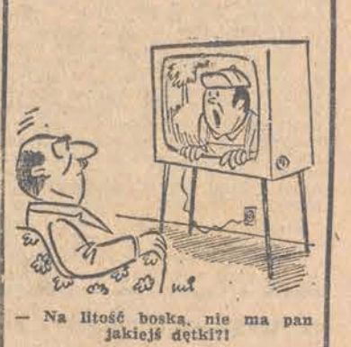
— Na ilość boska, nie ma pan jakiejś dętki?!