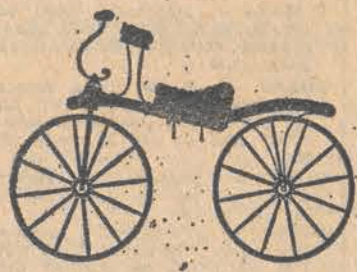
Ma takimi pojeździe hrabia de Sivrac przemierzał aleje królewskiego parku.

to pojazd na którym zdobywa się laury w kolarskich wyścigach