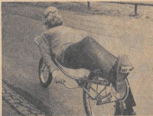
Rower dla leniwych miłośników rowerowej turystyki.