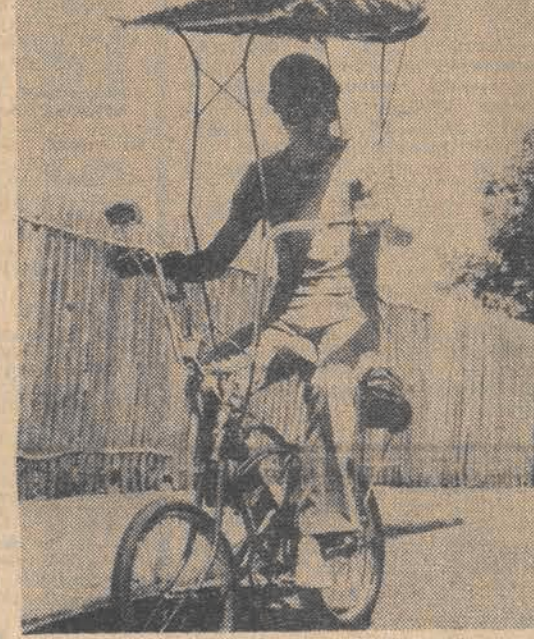
Daszek chroni rowerzystę przed żarem australijskiego słońca.