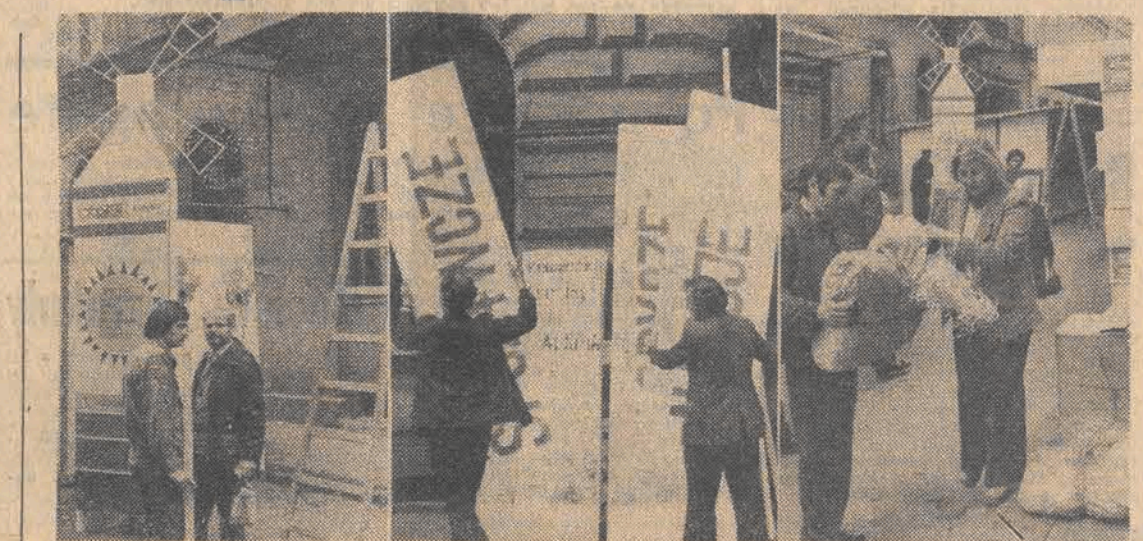
Foto-migawki s przygotował w jarmarkowym centrum na ul. Moniuszki.