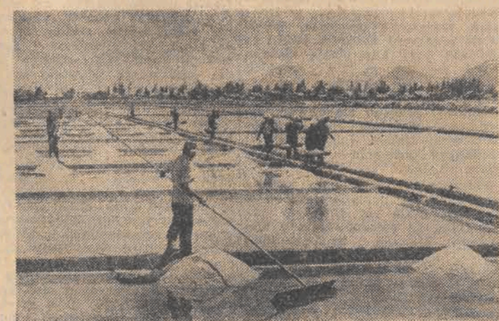
WIETNAM. W I kwartale tego roku warzelnia soli w Phu Khanh, jedna z wielu znajdujących się na wybrzeżu kraju, wyprodukowała 4.450 ton soli.

Sportową rewolucję finansową w poważnej mierze wywołała telewizja. Coraz wyższe wpływy z transmisji telewizyjnych pozwalają klubom na zakup najlepszych graczy.