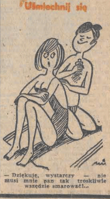
— Dziękuję, wystarczy — nie musi mnie pan tak troskliwie wszędzie smarować...

Taka sobie myśli Lepiej mieć dziesięciu mężczyzn niż jedną kobietę.