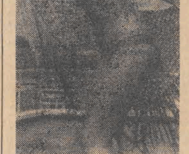
Panie, które potrafią sztytkować i którym nieobce są tajniki robienia na drutach...