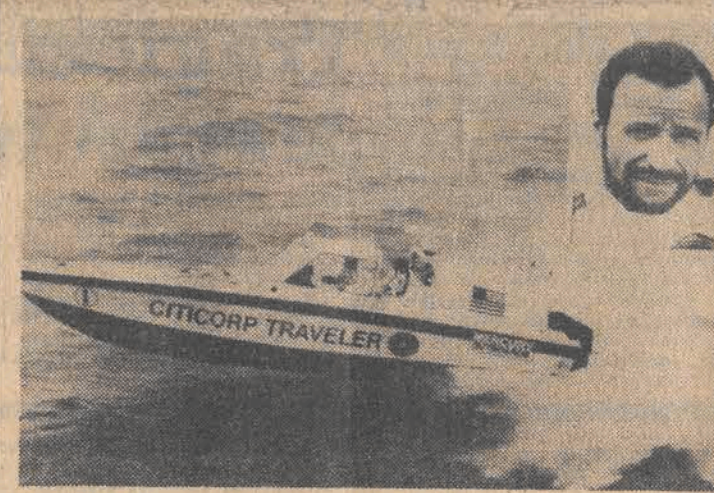
Trzech amerykańskich „wilków morskich” odbiło w piątek od wybrzeży Hiszpanii, aby na 11-metrowej łodzi motorowej i silnikiem o dużej mocy pobić dotychczasowy rekord czasu przepłynięcia Atlantyku...