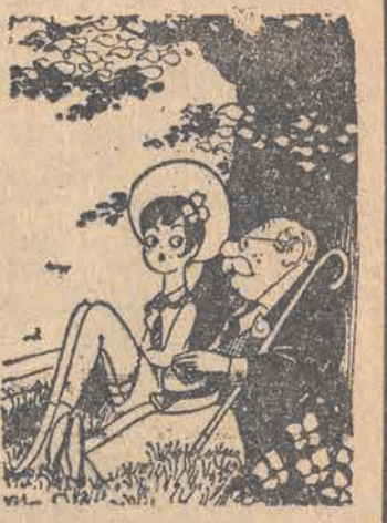
— Niech pani sobie wyobrazi, że mam 20 lat... „Ici Paris”