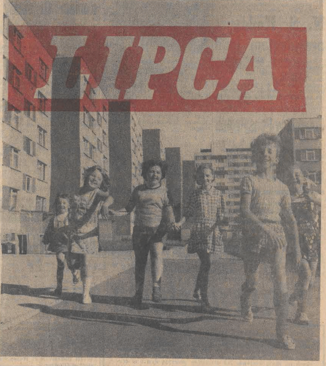
W PRZEDDNIU ŚWIĘTA NARODOWEGO