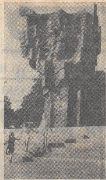
Pomnik Władysława Broniewskiego w jego ukończonym mazowieckim mieście - Plocku.