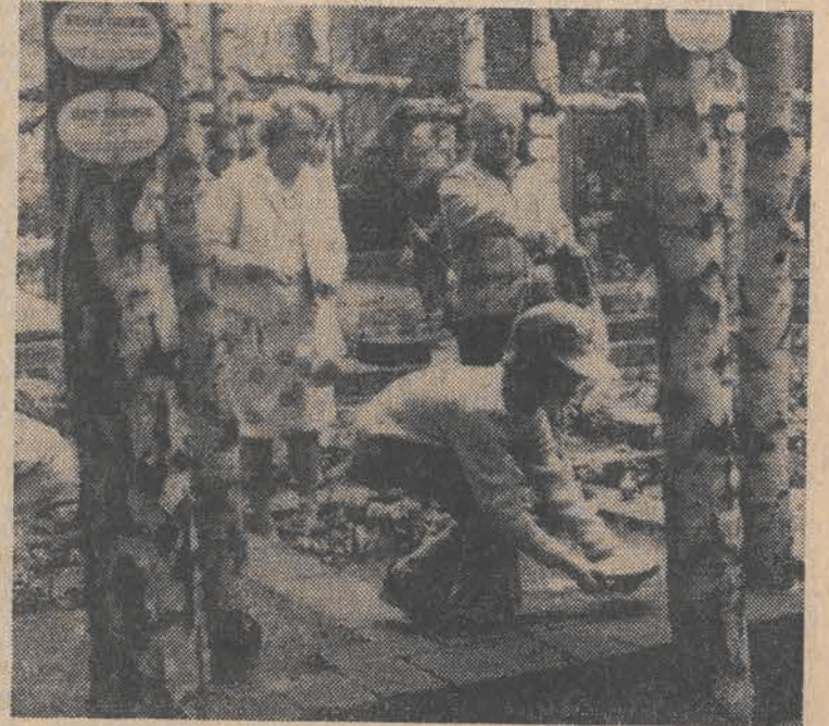
Na zdjęciu: w kwaterach powstańców na Cmentarzu Powązkowskim.

Wczoraj, w 33 rocznicę wybuchu Powstania Warszawskiego społeczeństwo stolicy oddało hold pamięci bohaterów-żołnierzy, poległych na barykadach oraz walczącej wraz z nimi ludności cywilnej.