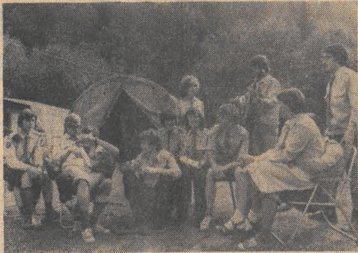
Bieszczady-40. W tym roku jej uczestnicy, a było ich ponad sześć tysięcy, pracowali na różnych bieszczadzkich budowlach, przy budowie dróg, pielęgnacji lasów, układaniu pól namiotowych i wycieczaniu na wycieczki szlaków turystycznych. N/z: w obozie harcerzy ze Skierzwic.