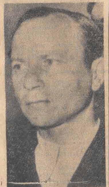
CAF - AP - telefoto

Zachodniemiecka agencja DPA poinformowała we wtorek po południu, że spotkanie kanclerza Helmuta Schmidta z premierem