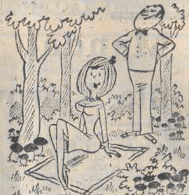
— To chyba bardzo odludne miejsce, panie Kazim, skoro tu tyle grzybowi...

PAN WOJTUS WRÓCIŁ Z UROLOPU NA JEZIORACH I OPowiada o RYBACH.