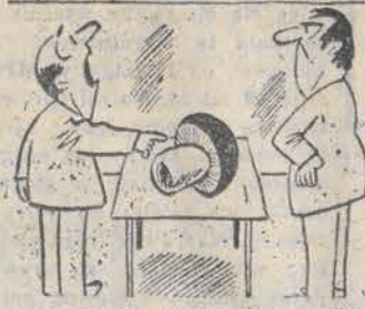
— Ależ, wysoki sędzie, to ja go pierwszy zobaczyłem!