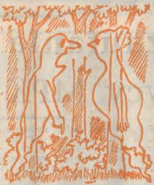
— Tędzien temu upierałaś się w tym miejscu, że te grzyby są jadalne!