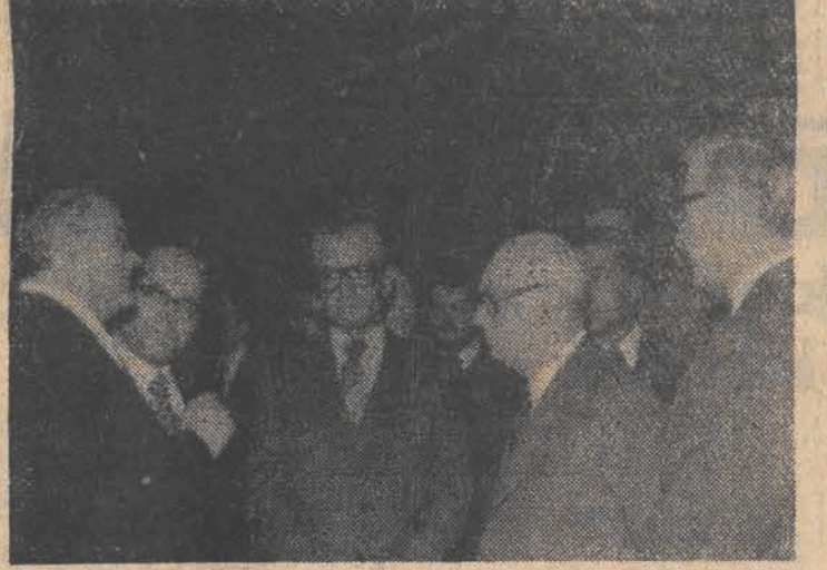
N/z: podczas zwiedzania Zakładów H. Cegielski.

Należą one do najstarszych, a jednocześnie do największych i nowoczesniejszych w naszym kraju. Następnie dostojni goście z zainteresowaniem oglądali nowoczesne, wyposażone na najwyższym poziomie światowym — wężły produkcyjne. Przy stanowiskach pracy widnieją proporzeczki i barwy Iranu i Polski. Szachinszach, któremu wyjaśnił udział zakładowi specjalści, interesuje się różnymi sprawami produkcyjnymi. Warto nadmienić, że wyroby fabryki obrabiarek HCP zareklamowały się już na rynku irańskim. Dostojnych gości poinformowano iż w ostatnich latach nastąpił dalszy rozwój zakładu, który jest nowoczesnym zakładem produkcyjnym. W tym celu rozpoczęto budowę nowego obiektu produkcyjnego, który zwiększy zdolności produkcyjne zakładu. W tym celu rozpoczęto budowę nowego obiektu produkcyjnego, który zwiększy zdolności produkcyjne zakładu. (Dalszy ciąg na str. 2)