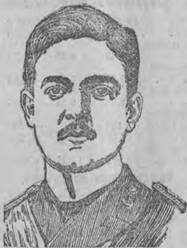
Manuel, król portugalski.

Walka między rządem a republikanami była zacięta. Republikanów, a nawet ludzi podejrzanych tylko o republikanizm, więziono, mnóstwo ich puciekowało z kraju w obawie aresztowań. Nawzajem stronictwo wrogie rządowi wyzyskiwało każdą sposobność, aby ten rząd w oczach narodu zohydzić. A takich sposobności nie brakło. Zwłaszcza lekceważenie prawa, nadmiar ucisku i wadliwa gospodarka pieniężna dostarczały, jak i poprzednio, mnóstwo powodów do zjadliwej krytyki.