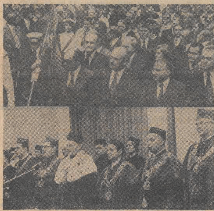
Goście i gospodarze podczas wczorajszej uroczystości inauguracyjnej w łódzkiej Akademii Medycznej. Dla ścisłości: studenci pierwszego roku także czuli się już gospodarzami.