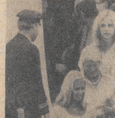
N/zt: pasażerowie po powrocie do Frankfurtu.

Zakończenie dramatu pasażerów porwanego „Boeinga 737” W nocy z poniedziałku na wtorek zakończył się trwający 106 godzin dramata pasażerów samolotu „Luftthansy”, który w czwartek 13 bm. został porwany przez 4 terrorystów. O godzinie 01.57 czasu miejscowego (czyli 23.57 naszego czasu) 28 żołnierzy oddziału specjalnego do walki z terroryzmem który przybył do Mogadyszu samolotem „Boeing — 707”, rozpoczęło akcję przeciwko zamachowcom. Za pomocą specjalnych granatów, oślepiających i paraliżujących na 6 sekund, wyważyli drzwi maszyny i dostali się do środka. Pierwszą strzałę. Już 2 minuty po rozpoczęciu akcji pierwsi pasażerowie zaczęli wychodzić z pasażerów opuszczając samolot. Ewakuacja pasażerów odbyła się szybko i już po paru minutach wszyscy zostali wprowadzeni na zewnątrz. Powołuje się na somalijską