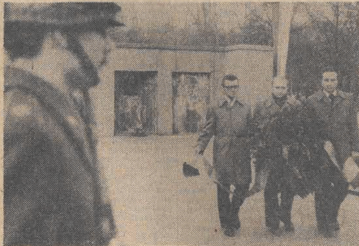
Na zdjęciu: wieniec składa delegacja KL PZPR.

Szczególnie podniosły charakter miały uroczystości w stolicy.