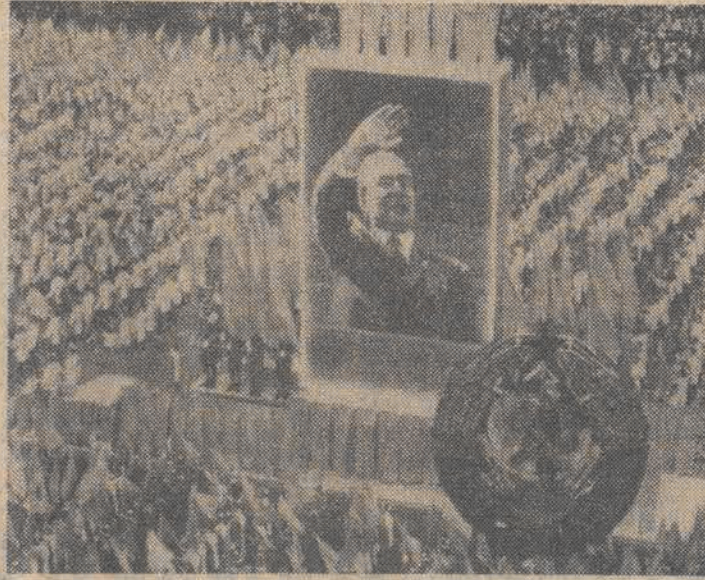
Na zdjęciu: manifestacja na Placu Czerwonym w Moskwie.

Partia komunistyczna i rząd radziecki — oświadczył na Placu Czerwonym. (Dalszy ciąg na str. 2)