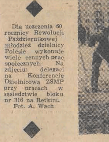
Dla uczczenia 60 rocznicy Rewolucji Październikowej młodzież dzielnicowej Polesie wykonała wiele cennych prac społecznych. Na zdjęciu: delegaci na Konferencję Dzielnicową ZSMP przy pracach w sąsiedztwie bloku nr 316 na Retkini.

Dom drzy w posadach W stanie permanentnego „trzęsienia ziemi” jest dom przy ul. Gdanskiej 86. Nawierzchnia ulicy w okolicy tej posesji jest bowiem tak zniszczona, iż każdy przejazd tramwaju powoduje opadanie tynku ze ścian i sufitów, a ostatnio spadają nawet rzeczy ze stółków. Ten stan trwa od dłuższego czasu, powodując zrozumiałe zdenerwowanie okolicznych mieszkańców.