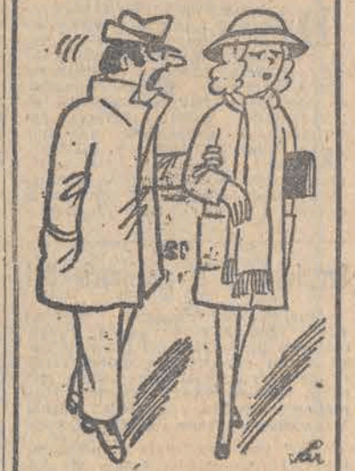
— Co to był za facet, z którym w ogóle nie rozmawiałam i ani razu na niego nie spojrziałam przez cały wieczór, co!

Taka sobie myśl Miłość rozbiła okowy samoności. Uśmiechnij się