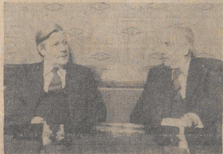
22 bm. kanclerz federalny RFN Helmut Schmidt spotkał się w gmachu Sejmu z I sekretarzem KC PZPR Edwardem Gierkiem.

22 bm. w elektrowni „Jaworzno III” przeprowadzono ważną operację technologiczną przy czwartym bloku energetycznym o mocy 200 MW — rozpalenie kotła, o wydajności 650 ton pary na godzinę. Czynności te poprzedzają bezpośrednio uruchomienie tej nowej jednostki prądowzręcej, która ma zostać włączona do sieci państwowej w najbliższym czasie. Elektrownia „Jaworzno III” dysponować będzie wówczas łączną mocą 800 megawatów.