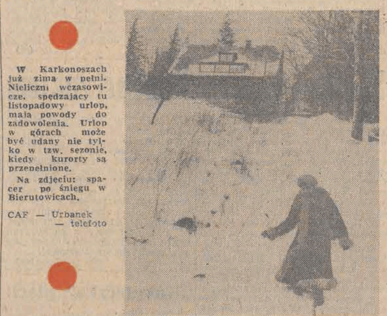
W Karkonoszach już zima w pełni. Nieliczni czasowicze, spędzający tu listopadowy urlop, mała powody do zadowolenia. Urlop w górach może być udany nie tylko w tzw. sezonie, kiedy kurorty są przepełnione. Na zdjęciu: spacer po śniegu w Bierutowicach.

Synoptycy opracowali kolejną wersję prognozy na najbliższych 30 dni. Obejmuje ona okres od 21 listopada br. do 20 grudnia br. Średnia temperatura tego okresu ma być w normie, czyli w przedziale od minus 0,5 st. do plus 0,9 st., a suma opadów nieco przekroczy normę, czyli będzie wyższa od 42 mm deszczu. Oto szczegółowa prognoza: