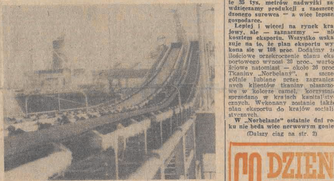
W pierwszych dniach grudnia portowcy rejonu przeładunków masowych Portu Północnego w Gdańsku wykonali swoje tegoroczne zadania. Od momentu uruchomienia portu, tj. od 1974 roku, przyjęto w bazie węglowej 850 statków, w zjedzeniu: załadunek węgla w Porcie Północnym.