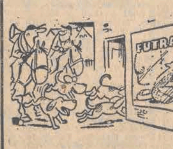
— Łeoz. Coś tu nie gra!

Wcześniejsze rocznice 1962 — Rozpoczął pracę biostocki Ośrodek TV. Taka sobie myśl Kiedy trzosa pełny, to przyjaciel pewny. (przysłowie ludowe) Uśmiechnij się