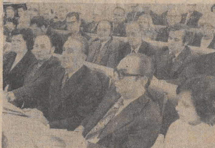
W drugim dniu obrad delegaci na sal.