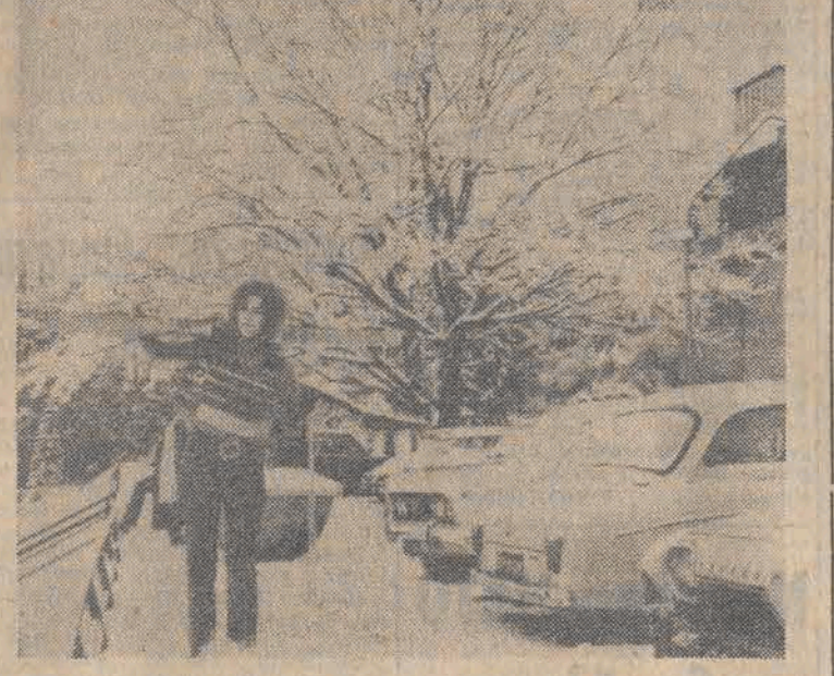
Zima w całej krasie, niestety, tylko w górach. Na zdjęciu: Karpacz.