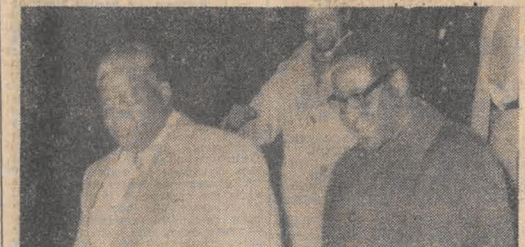
Na zdjęciu: J. Nkomo i R. Mugabe po przyjęciu na Malcie.

W poniedziałek przed południem w stolicy Malty rozpoczęły się rozmowy przywódców Frontu Patriotycznego Zimbabwe, J. Oshua Nkomo i Roberta Mugabe z przedstawicielami rządów w Brytanii i USA, Davidem Owenem i Andrewem Youngiem, poświęcone uregulowaniu problemu rodezyjskiego na podstawie anglo-amerykańskiego planu, przewidującego kontrolowane przez państwa zachodnie przekazanie władzy w Rodezji rdzennej ludności tego kraju. Występując z tą inicjatywą W. Brytania i USA pragną nie dopuścić do obalenia reżimu Smitha drogą walki zbrojnej, prowadzonej przez radykalne ugrupowania afrykańskie, zrzeszone w Patriotycznym Frontie Zimbabwe. W hotelu, gdzie toczą się te rozmowy, określone mianem spotkania ostatniej szansy, władze maltańskie podjęły wzmoczone środki bezpieczeństwa.