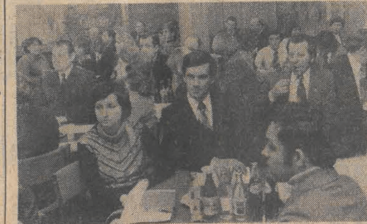
Sala obrad

Tzw. wojskowa komisja egipsko-izraelska wznowia obrady dziś, 31 bm. po południu w Kairze. Informuje o tym komunikat opublikowany w Tel Awiwie przez izraelskie Ministerstwo Obrony.