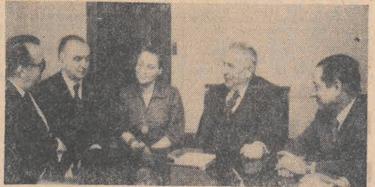
N/z: podczas spotkania.

28 LUTEGO I SEKRETARZ KC PZPR EDWARD GIEREK PRZYJĄŁ PRZEBYWAJĄCEGO W POLSCE NA ZAPROSZENIE NIE KC PZPR CZŁONKA PREZYDIUM, SEKRETARZA KOMITETU WYKONAWCZEGO KC ZKJ, STANISŁAWA DOLANCA.