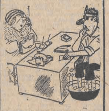
- Niech pani nie wierzy w te domowe sposoby leczenia kataru!