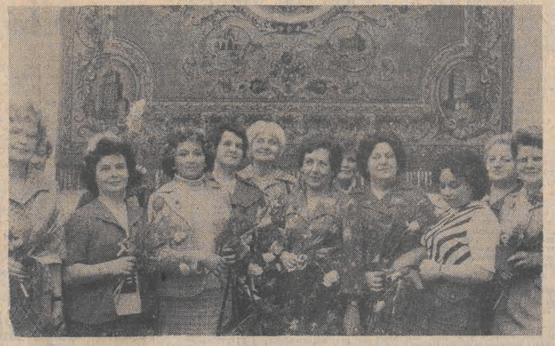
Na naszym zdjęciu grupa zasłużonych łodzianek, udekorowanych wczoraj w Urzędzie Miasta Honorową Odznaką M. Łodzi. Na ich ręce wszystkim łódzkim kobietom z okazji Ich święta składamy serdeczne życzenia wszelkiej pomyślności.