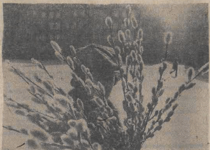
CAF - Kłoś