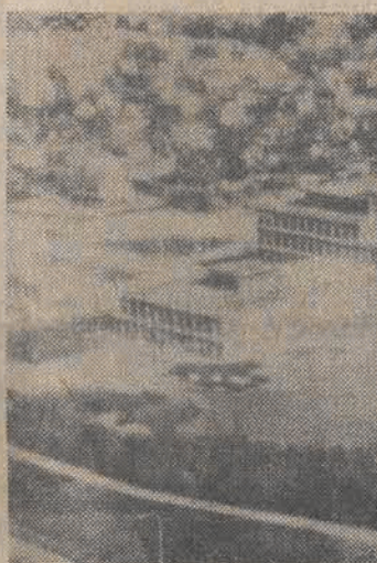
Na zdjęciu: budynek, w którym Molukańczycy trzymają zakładników.

W poniedziałek 6 terrorystów molukańskich opanowało budynek prefektury w Assen (Holandia) i zabrałszy 71 zakładników, zażądało uwolnienia więzionych na terenie Holandii terrorystów, którzy brali udział w poprzednich akcjach Molukańczyców na terenie tego kraju.