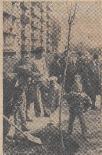
Po raz pierwszy „Zielone świadectwo urodzenia” zagościło na osiedlu „Czerwony Rynek”...