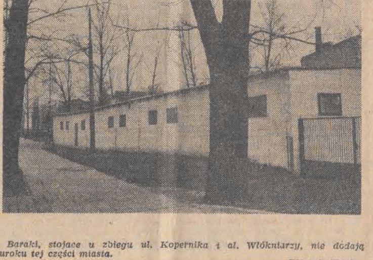
Barańki, stojące w zbiegu ul. Kopernika i al. Wióknarzy, nie dają uroku tej części miasta.