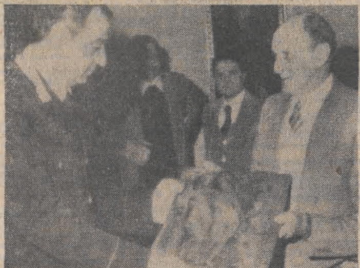
Na zdjęciu: odzyskany obraz Rubensa „Trzy gracze”.

W niespełna 30 godzin od kradzieży w florenckiej Gallerii Pitti 18 obrazów wartości ponad 1,1 mln dolarów.