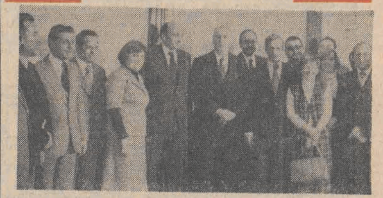
Na zdjęciu: Edward Gierek wśród uczestników spotkania.

Wczoraj odbyło się kolejne, okresowe spotkanie I sekretarza KC PZPR, EDWARDA GIERKA z kilkusetosobową grupą dziennikarzy polskich.