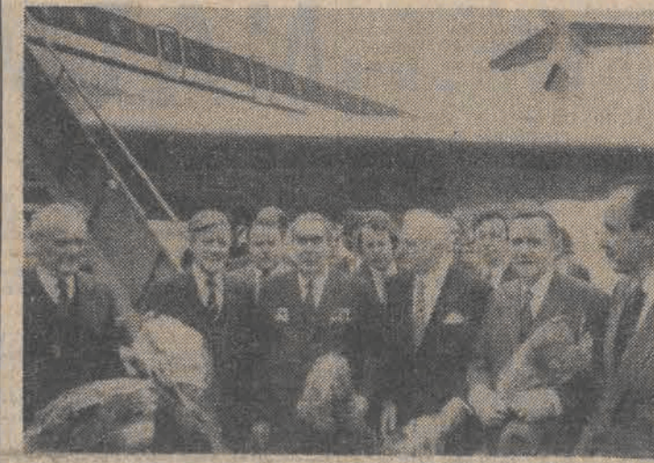
N/z: powitanie na lotnisku w Bonn.

W czasie rozmowy L. Breżniewa z W. Scheelem wymieniono poglądy (Dalszy ciąg na str. 2)