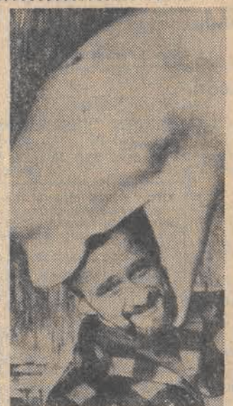
Wygląda to groźnie, ale jest to po prostu objaw miłości ze strony wielkiego białego wieloryba do ZOO w Duisburgu wobec opiekuna, Wolfganga Geualla.

Dzięki amerykańskiej pomocy wojskowej, której wartość w okresie minionych 7 lat wyniosła ponad 7 mld dolarów Izrael - według danych prasy amerykańskiej ma obecnie 600 samolotów wojskowych, 3 tys. czołgów, 3,5 tys. transporterów opancerzonych. Tel Aviv otrzymał za Stanów Zjednoczonych rakiety „Lance” urzędnicy elektroniczne. W najbliższym czasie ma otrzymać 90 amerykańskich myśliwców „F-17” i „F-16”. Izrael rozbudowuje również własny przemysł zbrojeniowy, przy wydanej pomocy amerykańskich firm zbrojeniowych. Dzięki ich pomocy, w Izraelu uruchomiono produkcję czołgu „Chariot”, wyposażonego w silnik produkcji amerykańskiej.