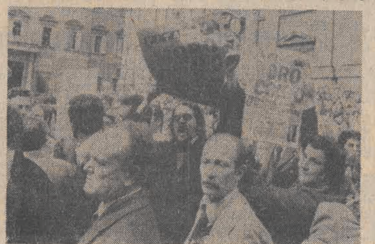
Po zamordowaniu Aldo Moro, w Rzymie ukazały się 8 bm. specjalne wydania gazet. Tysiące mieszkańców stolicy Włoch wyszło na ulice, potępiając zbrodnię „Czerwonych Brygad”. N/z: tłumy przed siedzibą Partii Chrześcijańsko-Demokratycznej, gdzie znaleziono w bagażniku samochodu zwłoki Aldo Moro.

Wiadomość o zdobyciu w ten sposób najwyższego szczytu Himalajów została potwierdzona we wtorek w Katmandu przez nepalskie Ministerstwo Turystyki. Szturmowanie szczytu z obozu, położonego na wysokości 8.000 metrów odbyło się w bardzo szybkim tempie i trwało 6 godzin.