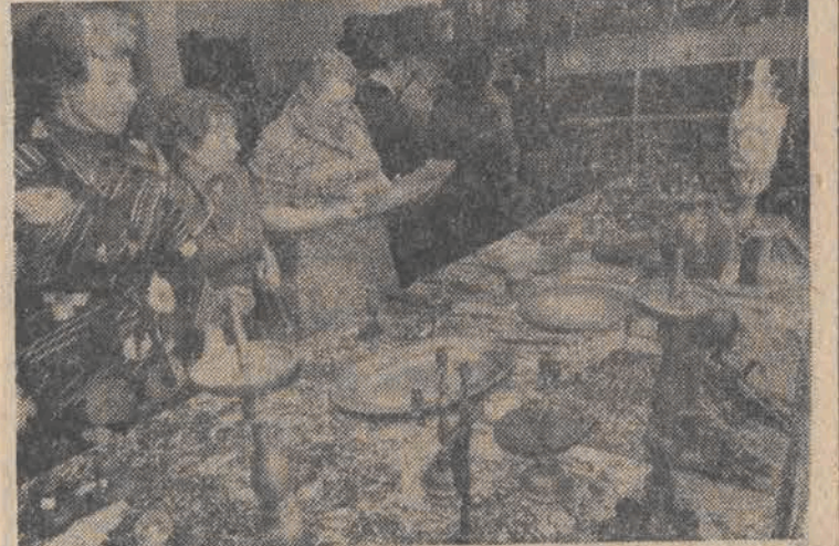
Prawie trzy tysiące dzieł sztuki — obrazów i ikon, monet, starodruków, wyrobów z cyny, srebra, złota i metalu, przekazały 13 bm. polskie urzędy celne do muzeum. Na specjalnej wystawie zaprezentowane zostały antyki, które usiłowano w ostatnich latach nielegalnie wywieźć z kraju.