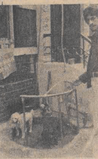
Pełna psia kultura zapanowała w nowojorskiej dzielnicy Greenwhich Village, odkąd za instalowano tu osie toalety za spuszczenia woda.