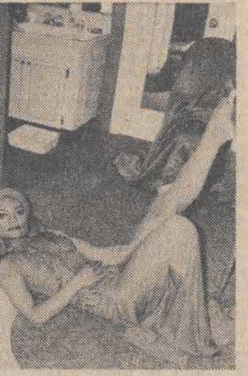
Wynna niegdyś piosenkarka Ertha Kitt występuje obecnie w musicalu „Timbuktu” na Broadwayu. Ertha powróciła na scenę po 20-letniej przerwie.