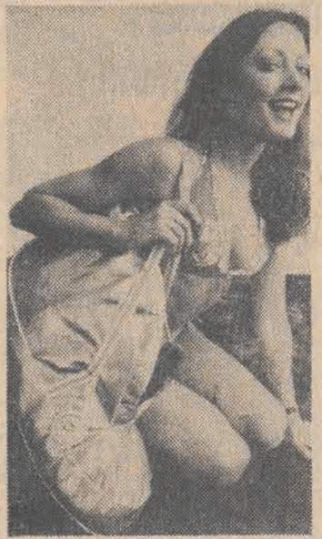
Do taekiel torby zmieszczą się wszystkie drobiazgi...