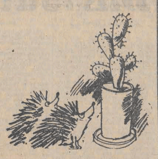
Wydaje mi się, że to pomnik Jeża...

NIESTROŻNOŚĆ I LEKKOMYŚLNÓŚĆ w pracach ziemnych spowodowały w ostatnim czasie ogromne straty. W woj. bydgoskim rolnik, kopiąc w swoim gospodarstwie, zniszczył kabel linii międzymiastowej, przerywając łączność między Poznaniem, a Bydgoszczą i Piłą. Naprawa uszkodzenia kosztowała 350 tys. zł. Na trasie E-16 w Włocławku operator koparki zniszczył kabel międzymiastowy, co pociągnęło za sobą straty w wysokości 400 tys. zł. Podobny wypadek w woj. toruńskim na całą noc przerwał połączenie telefoniczne na 600 łączach z Warszawy, a kosztowało to prawie pół miliona.