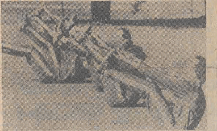
Polscy piłkarze trenują w Jockey Clubie w Rosario w przeddzień meczu z Tunezją. N/z: na pierwszym planie Henryk Kasperczak, w głębi Mirosław Justek.