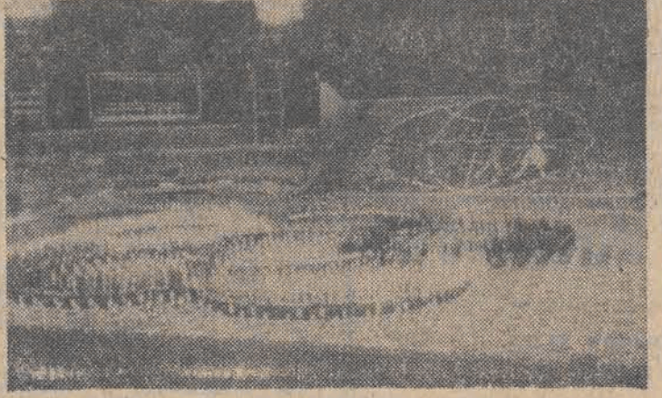
15 bm. w Hawanie odbyła się próba generalna pokazów gimnastycznych, które 28 bm. otworzą Światowy Festiwal Młodzieży na Kubie.

Wielkie zainteresowanie mieszkańców Kuby wzbudziła podana przez dziennik „Granma” wiadomość, że polska delegacja na XI Światowy Festiwal Młodzieży i Studentów przybędzie do Hawany przywożąc duży balon o pojemności ponad 800 metrów sześciennych, symbolizujący jedność młodzieży całego świata. Balon zawieszony nad Hawanę, stając się jednym z głównych elementów dekoracji festiwalowej. Kubańskie środki masowego przekazu piszą, że balon festiwalowy został skonstruowany przez studentów białostockiej filii Uniwersytetu Warszawskiego.