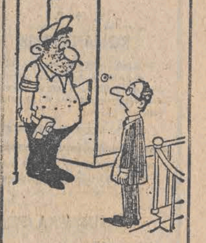
— Jestem sasiadem z dołu. Chce panu powiedzieć że pańskie walenie młotkiem w ścianę o dziesiątej wieczorem bardzo mi się... podobają.