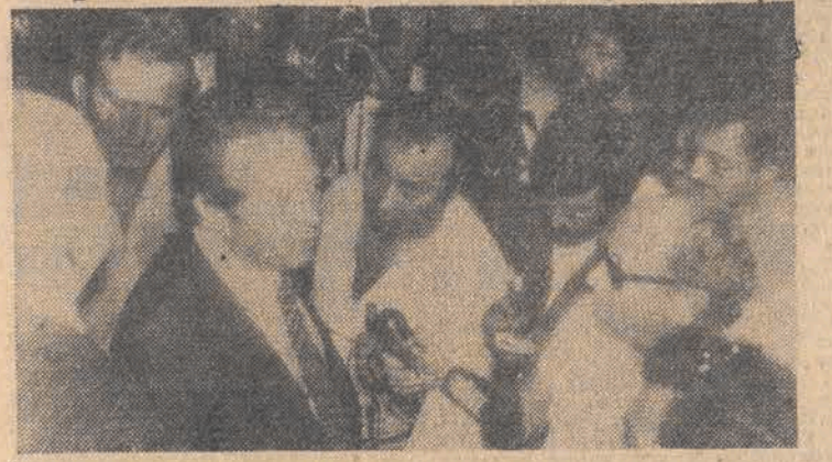
Premier portugalski, Mario Soares udziela wywiadu dziennikarzom na temat kryzysu rządowego, spowodowanego dymisją trzech ministrów z Centrum Demokratyczno-Społecznego.

Kierownictwo Socjalistycznej Partii Portugalii udzieliło we wtorek poparcia premierowi Mario Soaresowi i jego rządowi, prze-