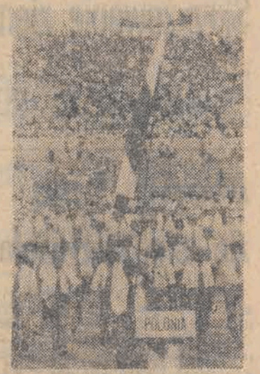
N/z: delegacja polska podczas uroczystości otwarcia.

ratury naukowej, zainstalowanej na zewnętrznej powierzchni stacji. Z pomocą tej aparatury przez 10 miesięcy, od chwili wprowadzenia stacji w przestrzeń kosmiczną, przeprowadzono doświadczenia dotyczące badania sytuacji w dziedzinie mikrometeoritów oraz wpływu środowiska kosmicznego na własności różnych materiałów.