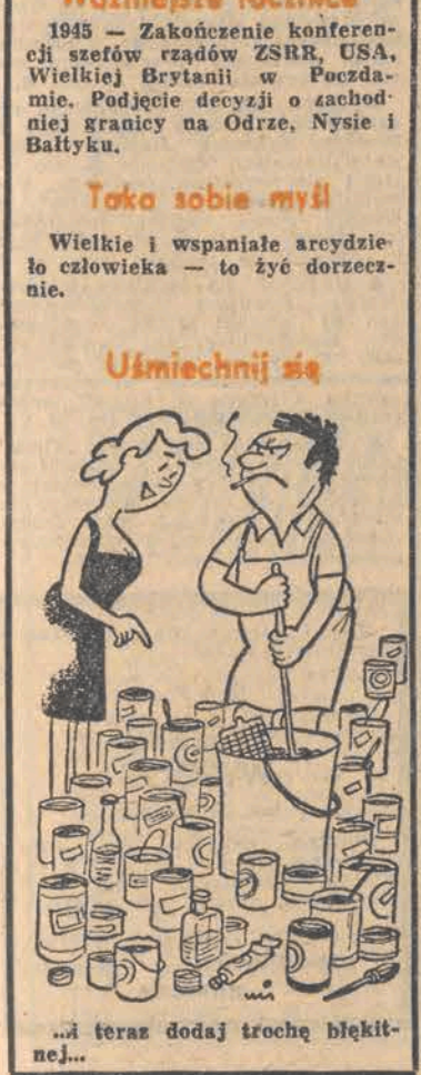
...a teraz dodaj trochę błękitnej...

W 214 dniu roku słońce wzeszło o godz. 4.57, zajdzie zaś o 20.26. Imieniny obchodzą Gustaw, Karina Dziurny synoptyk w dniu dzisiejszym dla Łodzi przewiduje następujące pogody: zachmurzenie małe lub umiarkowane. Temperatura od 15 do 23 st. C. Wiatry słabe — wschodnie i południowo-wschodnie. Cisnienie o godz. 19 wynosiło 997,4 hPa (748,1 mm). Ważniejsze rocznice 1945 — Zakończenie konferencji szefów rządów ZSRR, USA, Wielkiej Brytanii w Poczdamie. Podjęcie decyzji o zachodniej granicy na Odrze, Nysie i Bałtyku. Tako sobie myśl Wielkie i wspaniałe arcydzieło człowieka — to życie dorzecznice. Uśmiechnij się