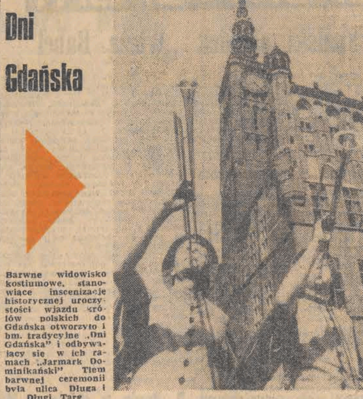
Barwne widowisko kostiumowe, stanowiące inscenizację historycznej uroczystości wzniesienia śródo-w polskich do Gdańska otworzyło 1 bm. tradycyjnie „Dni Gdańska” i odbywały się w ich ramach „Jarmark Dominikański”. Tem barwnej ceremonii była ulica Długa i Dniul Tarz