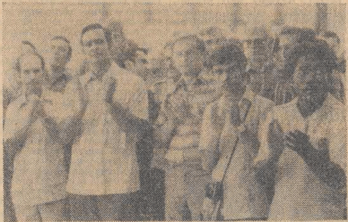
XI Festiwal Młodzieży i Studentów w Hawanie. N/z: spotkanie festiwalowych delegacji Polski i Kuby.

Niezwykle uroczyste powitanie we wtorek rano na lotnisku hawańskim im. Jose Martí przez polskiego kosmonautę Mirosława Hermaszewskiego. Obecni byli przedstawiciele kierownictwa XI Światowego Festiwalu Młodzie-