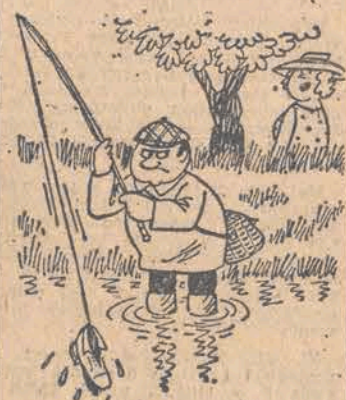
— Bądź cierpliwy! Może słowisz drugiego do pary!