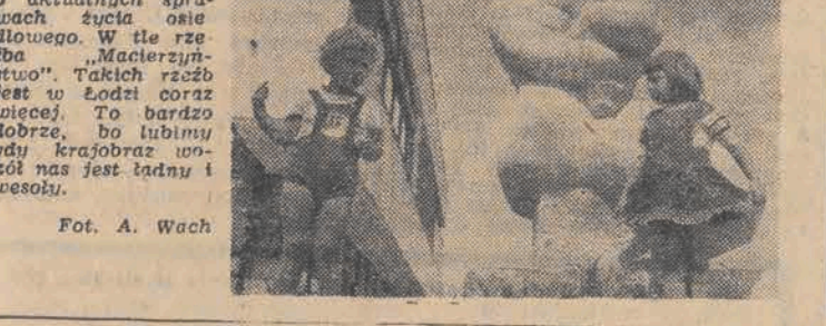
Krótką rozmówką o aktualnych sprawach życia osiedlowego. W tle rzeka "Macierzynska". Takich rzeczek jest w Łodzi coraz więcej. To bardzo dobrze, bo lubimy gdy krajobraz wokół nas jest ładny i wesoły.