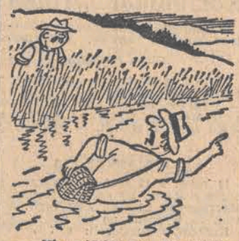
— Nie widział pan tu uciekającej ryby z wędką w pysku? — odjechał.