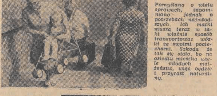
Pomyślano o wiośle sprawach, zapomniano jednak o potrzebach najmłodszych. Ich matki muszą teraz w taki właśnie sposób transportować swoje dzieci ze swoimi pociechami. Szkoda że tak się stało, bo na osiedlu mieszka wiele młodych małżeństw, więc będzie i przyrost naturalny.