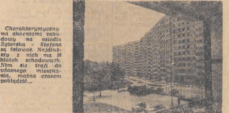
Charakterystyczny mi akcentami zabudowy na osiedlu Zgierska - Stefana są fatowce. Najdłuższy z nich ma 16 klatek schodowych. Nim się trafi do własnego mieszkania, można czasem pobłądzić...